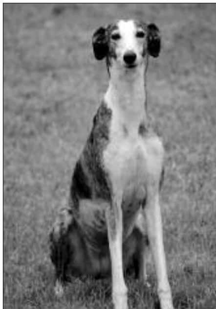
En zo verdween de windhond in Maaseik

Koning Leopold I ondertekende op 13 mei 1832 een besluit, waarbij hij aan het gemeentebestuur van Maaseik de toelating gaf om een belasting te heffen op het bezit van honden “overwegende dat de voorgestelde maatregel voor voorwerp heeft om de zeer menigvuldige aangroei van honden te beletten en de ongevallen die kunnen volgen tegen te gaan” .