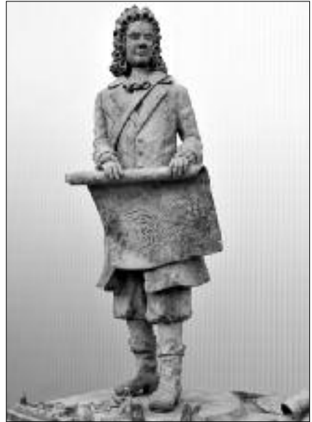
Sébastien de Vauban

Een bespreking van de Maaseiker versterkingen vraagt enige toelichting. De uitvinding van het buskruit stelde een einde aan een manier van oorlogvoeren die eeuwenlang opgeld had gemaakt en zorgde voor een omwenteling in het fortificatiesysteem. Bescherming door hoge, maar zwakke stadsmuren tegen het geschut voldeed niet langer en daarom werden de muren verlaagd en vervangen of versterkt door brede van aarde opgeworpen wallen, waartegen een kanonsbal niet veel vermocht. De vroegere muurtorens, ook een gemakkelijk doelwit voor het geschut,