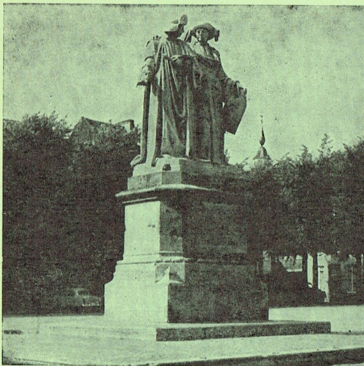
JAN EN HUBERT VAN EYCK